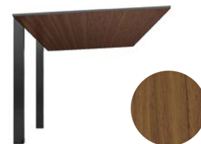
クリエモカ + ブラック

重厚なブラックウォールナット(クルミ)材の素材感を生かした、ミディアムモカブラウン。