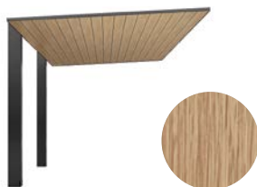
オーク + ブラック