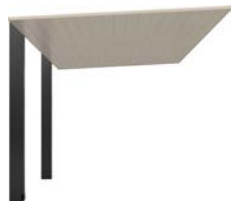
シャイングレーF + ブラック