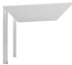
ナチュラルシルバーF