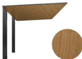
チェリーウッド + ブラック